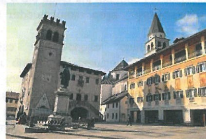
PIEVE DI CADORE